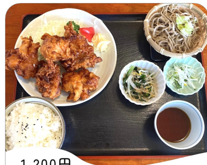
1,200円 (平日ランチ価格) からあげ定食

かめま便 Instagramアカウントで鹿沼市のおすすめスポットを若者目線で紹介しています！是非ご覧ください！！