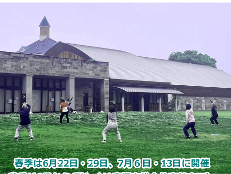
春季は6月22日・29日、7月6日・13日に開催 秋季は9月から(詳しくは鹿沼市総合体育館まで)