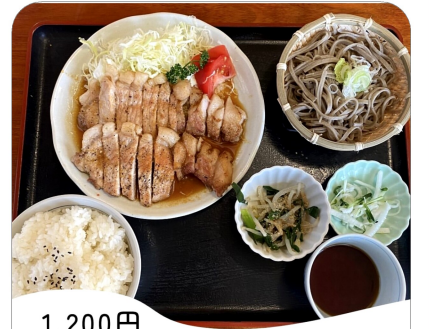
1,200円 (平日ランチ価格) 焼肉定食(んにくだれ)

所在地 鹿沼市榎木167-1 営業時間 昼11時～14時 夜17時30分～20時 (平日は営業時間が異なる場合があります) 電話 0289-75-4769 定休日 水曜日 駐車場 20台